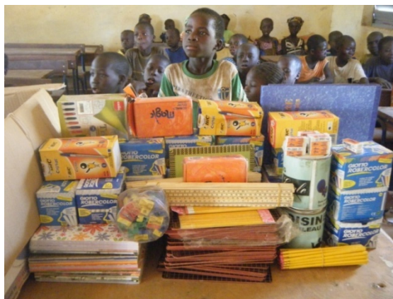
Livraison des fournitures à Sogoutoun novembre 2013

La cantine : Bénéficie encore cette année de l'aide du PAM (Programme Alimentaire Mondial) pour les vivres (mil, haricots, huile) ; les 124 élèves y déjeunent, ce qui garantit leur présence l'après midi en classe. Les familles participent chaque trimestre à l'achat des « condiments » (pour la sauce)