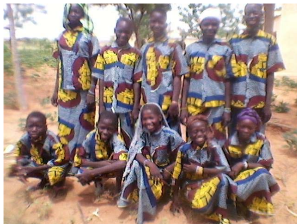
photo Les 10 collégiens en uniforme novembre 2013

L'entrée au Collège : 35 élèves de Sogoutoun y sont depuis la rentrée. L'aide financière de l'École pour tous a permis de financer TOUS les actes de naissance ainsi que les uniformes et fournitures des 5 meilleures filles et 5 meilleurs garçons de 6ème A.